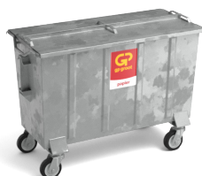
Papier/karton container 1100, 1700 en 2400 liter